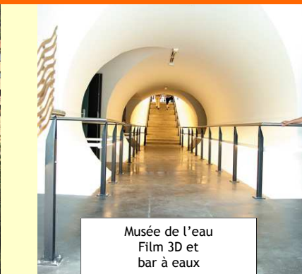
Musée de l'eau Film 3D et bar à eaux