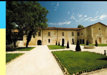
Le couvent des Carmes Musée des Dauphins et de la flore en Vercors