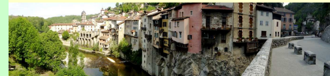
Pont en Royans, site classé des Maisons suspendues