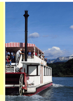
Croisière sur le Bateau à Roue